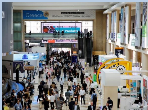
Κεντρικός διάδρομος με το banner της διαφημιστικής προβολής της Ελληνικής συμμετοχής